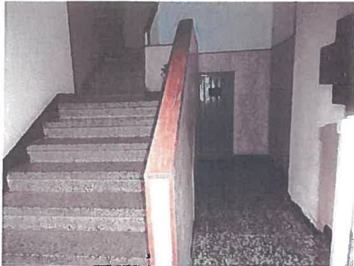
PORTAL (al fondo trastero 5)