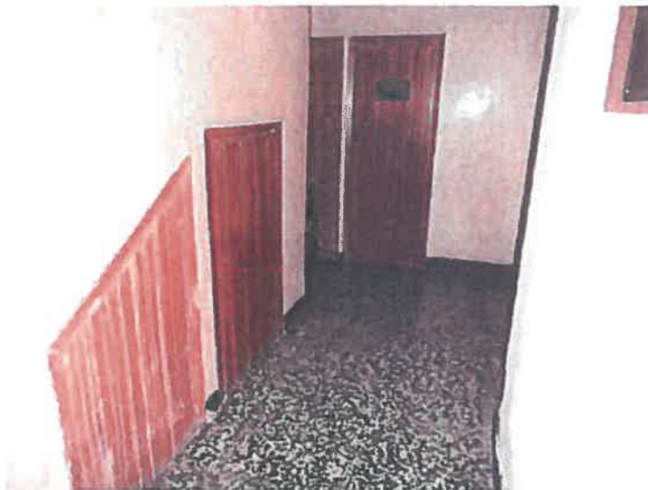
PORTAL (en 1er plano trasteros 1 y 2, al fondo trasteros 4 y 5)