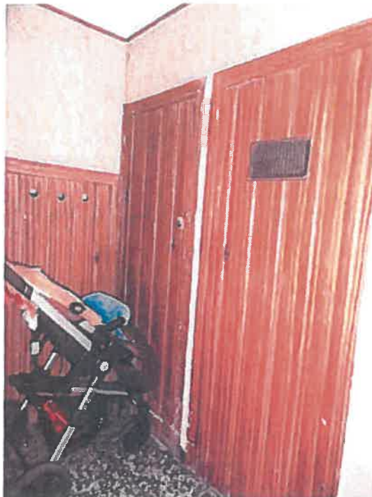
PORTAL (trasteros de izda. a dcha.: 3, 4 y 5)