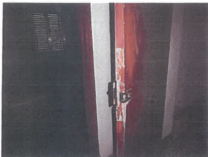
DETALLE DE PUERTA DE ENTRADA