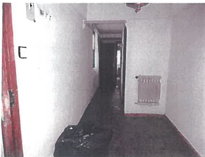
VESTÍBULO Y PASILLO